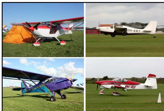
Foto's van de succesvolle fly-in van 2010.